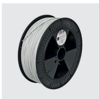
MAUER GRAU Sizes S, M, L from ¥18,000