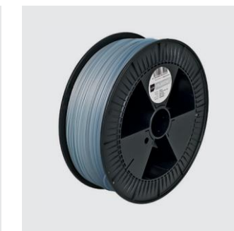
PVA TRUE SUPPORT Sizes S, M from ¥66,000

BigRep PVAは、3D印刷でサポート構造として広く使用されている水溶性合成ポリマーです。PVAは毒性が無く、無臭、押し出しをスムーズにします。