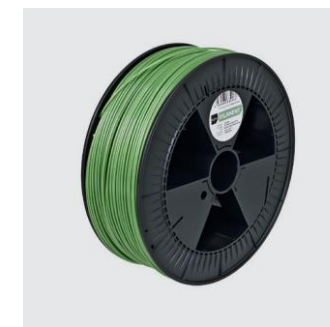
BERLINER WEISSE GRÜN Translucent Size S from ¥24,000