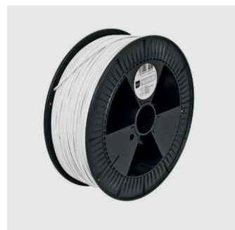
SCHNEEWEISS Sizes S, M, L from ¥18,000