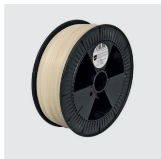
BERLINER LUFT Translucent Sizes S, M, L from ¥18,000

BigRep True Berlin Color PLAは、プロトタイプからデザインプロジェクト、そしてエンドユーザー部品から迅速なツーリングアプリケーションまで、あらゆるものに最適です。このフィラメントは190℃から225℃の間で非常にスムーズに押し出され、低吸湿性を保有しています。