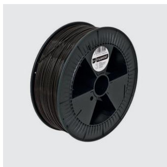
SCHWARZFÄHRER Sizes S, M, L from ¥18,000