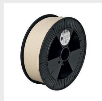
NATURE PRO HT Sizes S, M, L from ¥35,000