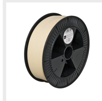
NATURE PRO HS Sizes S, M, L from ¥30,000