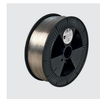
BERLINER WEISSE PUR Translucent Size S, M, L from ¥24,000

True Berlin Color のPETG フィラメントは無臭で押し出され、200℃から235℃までの範囲で、スムーズな流れを実現、透明なプリントにガラスのような光沢を与えます。