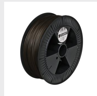
BLACK PRO HT Sizes XS*, S, M, L from ¥35,000

革新的な生分解性材料は、高い強度、強力な紫外線保護、115℃までの耐久性を保つ耐候性があります。