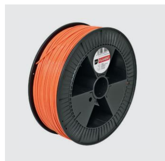
ROTES RATHAUS Size S from ¥18,000