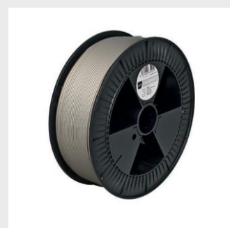
SILVER PRO HT Sizes S, M, L from ¥35,000