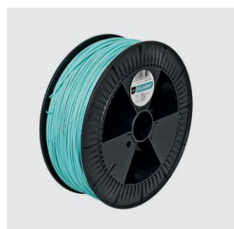
WANNSEE BLAU Size S from ¥18,000