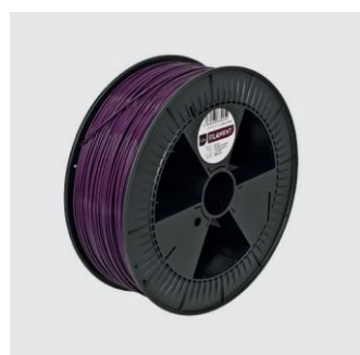
TENNIS BORUSSIALILA Size S from ¥18,000