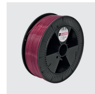
BERLINER WEISSE ROT Translucent Size S from ¥24,000