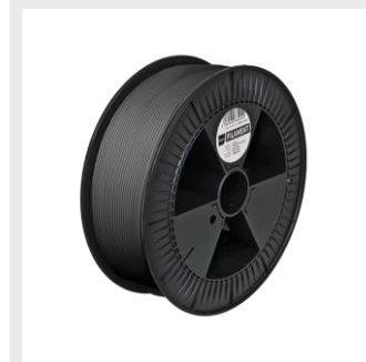
BASALT PRO HS Sizes S, M, L from ¥30,000

この強靭な生分解性材料は、生産時間を最大50%短縮し、高温耐性、流動性に優れています