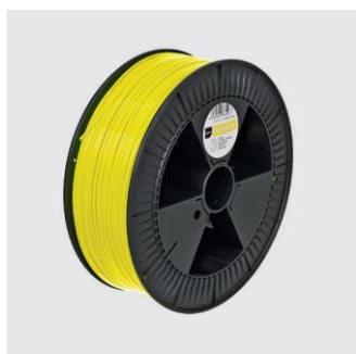
KREUZBERG GELB Size S from ¥18,000